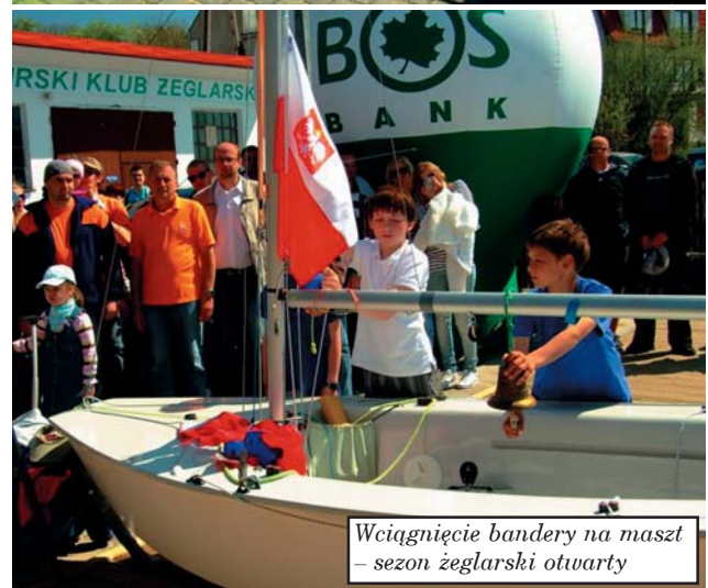
Wciągnięcie bandery na maszt – sezon żeglarski otwarty