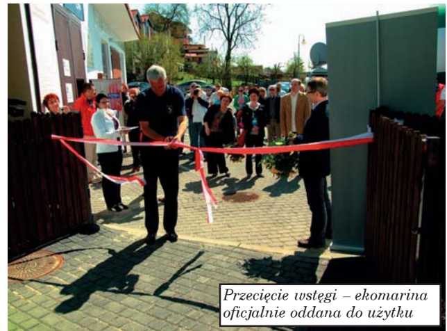
Przecięcie wstęgi – ekomarina oficjalnie oddana do użytku

Koszt przedsięwzięcia to 8 milionów euro. Ponad dwie trzecie tej sumy pochodzi z funduszy unijnych.