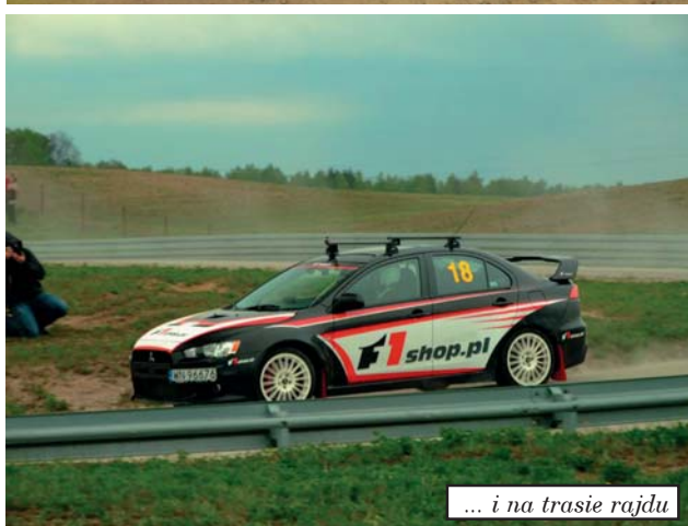
... i na trasie rajdu