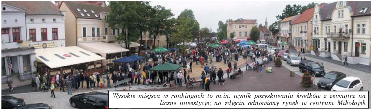
Wysokie miejsca w rankingach to m.in. wynik pozyskiwania środków z zewnątrz na liczne inwestycje; na zdjęciu odnowiony rynek w centrum Mikołajek

Gmina Mikołajki znalazła się w krajowej czołówce gmin najefektywniej inwestujących w infrastrukturę techniczną. To m.in. zasługa efektywnie pozyskiwanych środków unijnych ale i sporego zaangażowania własnych środków finansowych.