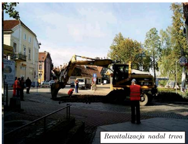
Rewitalizacja nadal trwa

Wydatki inwestycyjne naszej gminy w przeliczeniu na jednego mieszkańca wyniosły 1379 zł rocznie, a bez dotacji unijnych 793 zł rocznie. Dane te wskazują zarówno na umiejętność pozyskiwania funduszy UE ale także duże zaangażowanie środków własnych, które skrupulatnie przekazywane są na realizację inwestycji. Należy wskazać, że wśród wielu liderów