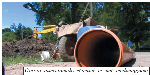
Gmina inwestowała również w sieć wodociągową

rankingu w kolejnych latach następuje duża rotacja, a Mikołajki od 2005 roku nie „wypadły” z krajowej dwudziestki. Wśród najlepszych w Polsce 50 gmin w kategorii małych miast poza Mikołajkami nie znalazła się żadna gmina z województwa warmińsko – mazurskiego.