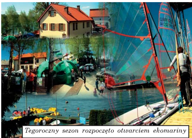
Tegoroczny sezon rozpoczęto otwarciem ekomariny