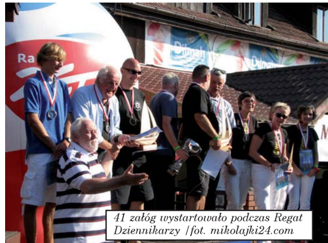
41 załóg wystartowało podczas Regat Dziennikarzy