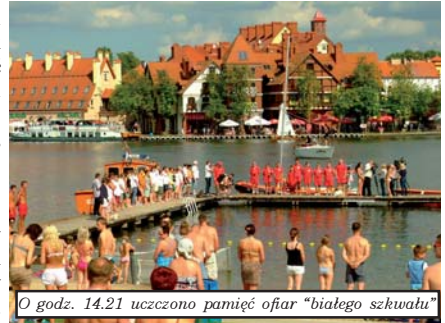
O godz. 14.21 uczczono pamięć ofiar „białego szkwiału”

Organizatorzy akcji (Urząd Miasta i Gminy w Mikołajkach, Mazurskie WOPR oraz Centrum Kultury „Kłobuk”) starają się wiedzę podawać w przystępny sposób. Stąd na plaży miejskiej przygotowano koncert lokalnego zespołu oraz – na zakończenie – znanego chóru Sound'n'Grace (który na plaży zagrał a cappella, wieczorem natomiast w pełnym składzie wystąpił w miejskim amfiteatrze, gdzie zdobył owacje na stojąco). Policjanci zorganizowali turniej