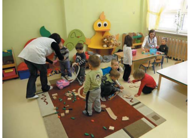
mają doświadczenie w pracy z małymi dziećmi.

- Opiekę nad maluchami pełni wykwalifikowany personel: mamy osoby, które ukończyły studia w zakresie pedagogiki opiekuńczo - wychowawczej, inni pracownicy wcześniej pracowali w przedszkolu i